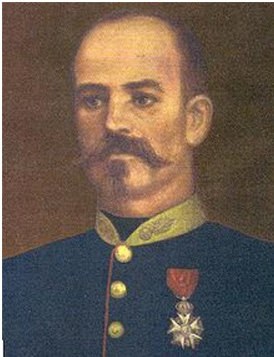
Capitán DANJOU ( 1828-1863)

Deben compartir este homenaje todos los hombres, de todos los países y de todos los tiempos, desde la edad de la flecha hasta la edad interestelar, que prefirieron perder antes la vida que ceder ante la fuerza... conservando así el valor verdadero del hombre, por la maravillosa afirmación del triunfo irresistible del espíritu sobre la materia.