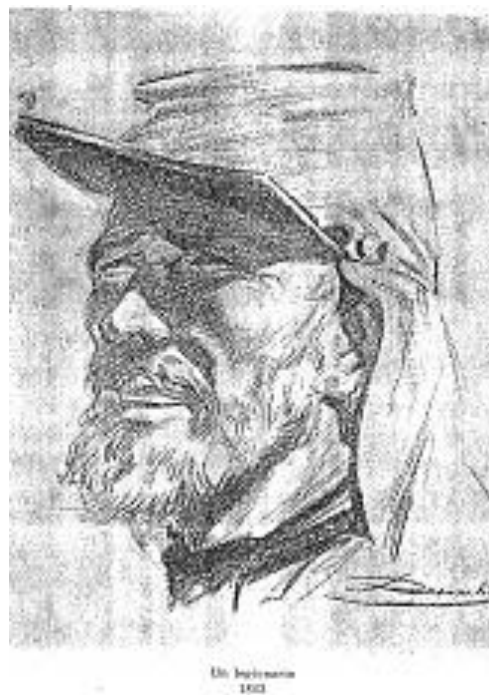
Legionario año 1863

¡Qué asombrosos son los designios del destino, que sin ninguna previsión posible, hacen emerger un nombre de la oscuridad, y le dan resonancia mundial! El dialecto de una pequeña provincia de Italia Central, el Lacio, debidamente transformado por los años y esculpido por los lugares, sirve hoy en día de medio de expresión a millones de seres humanos en el viejo y el nuevo Mundo. El nombre de una ranchería mexicana pronunciado hace un siglo solamente por algunos cientos de personas, es en nuestros días, conocido y venerado en todas las naciones del Mundo libre; y, cada año, en un día fijo, el 30 de abril, del Vietnam del Sur a Australia y de Lituania a la Tierra del Fuego, los corazones de miles de hombres, duros y altivos, se enternecen a la evocación de ese nombre: Camarón .